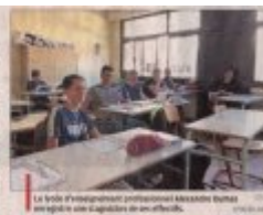
La semaine d'intégration professionnelle favorise l'intégration des élèves dans leur nouvel environnement.

Le lycée Alexandre-Dumas a accueilli 2 072 élèves. Ils ont découvert leur nouvel établissement où une semaine d'intégration et de cohésion leur est proposée. Des ateliers et des activités vont animer la semaine des lycéens, théâtre, jeux de piste ainsi qu'un pique-nique géant et un entretien individuel enseignants/élèves. Vendredi 6 septembre, une rencontre professeurs et parents est organisée de 13 h à 16 h.