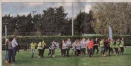
Les jeunes filles prennent le départ avec l'aide des élus.

Dans le même temps, des dons ont été récoltés, soit en chaque à l'ordre de 1000 T€.