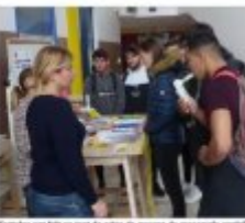
Les élèves ont participé à une série d'animations pour sensibiliser à l'arrêt du tabac.

Les lycéens ont été sensibilisés à l'arrêt du tabac. Une série d'animations a été organisée pour leur faire connaître les dangers du tabac et les avantages de l'arrêt. Les élèves ont participé à des ateliers de réflexion et de débat sur le thème de l'arrêt du tabac et de son impact sur la santé et le porte-monnaie.