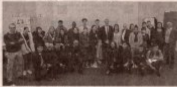
Le député aux côtés des élèves du lycée Alexandre-Dumas.