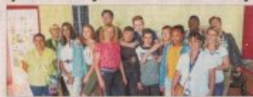
Une partie des élèves et accompagnateurs qui ont participé au rallye.

Mardi, toute la classe de première année CAP a participé au rallye culturel et citoyen organisé par le lycée Alexandre-Dumas. Les élèves ont parcouru la ville à la recherche de monuments historiques et ont photographié les lieux de dépôt illégaux.