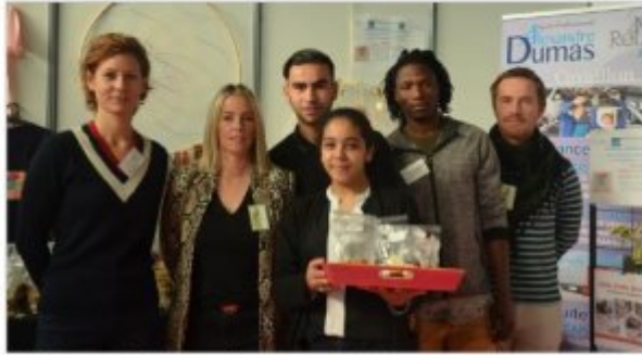
Le LEP Dumas sur la foire pour présenter son projet Madagascar.