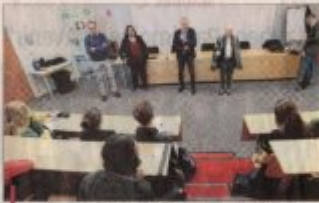
Les élèves du lycée Alexandre-Dumas ont découvert leur député en le questionnant et lui faisant des questions.

Une séance grand oral a été organisée au lycée Alexandre-Dumas ce mardi 18 décembre afin de présenter le rôle d'un parlementaire et répondre à leurs questions sur le fonctionnement de l'Assemblée nationale. À la question « Quel avenir étudiez-vous pour les députés ? », le député a répondu : « Avenir, même si Sciences Politiques et FENP, deux grands domaines, peuvent permettre d'accéder à la députation. Beaucoup de députés sont élus dans des départements où il y a une forte tradition politique. » « Quel est votre métier de député ? » « Quel est votre métier de député ? » « Quel est votre métier de député ? »