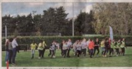
Les jeunes filles prennent le départ avec l'aide des élus.

2 km, 3 km, 4 km, 5 km et 6 km, les jeunes gens valides et les jeunes gens handicapés ont couru ensemble. L'objectif est de faire connaître le handicap aux lycéens du LDP Dumas au stade Jean-Roman.