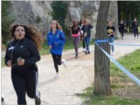
Les élèves ont couru 2.3 km.

Jeudi, au stade Jean-Roman avait lieu le 3 e cross solidaire du lycée Alexandre-Dumas. L'événement est organisé par les professeurs d'éducation physique pour aider la recherche et a réuni toutes les classes et les élèves du lycée. Plus de 600 jeunes étaient ainsi présents pour cette manifestation sportive inscrite dans le projet d'établissement.