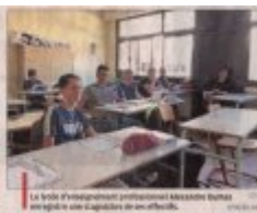
La semaine d'intégration professionnelle commence mardi et se termine vendredi 6 septembre.

Les lycées ont également été très touchés. A Cavillon, 2 072 élèves ont rejoint les salles de classe. Ils ont découvert leur établissement de l'autre côté de la route. Ils ont découvert leur établissement de l'autre côté de la route.