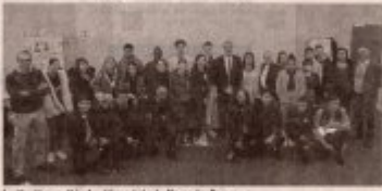
Le député aux côtés des élèves du lycée Alexandre-Dumas.