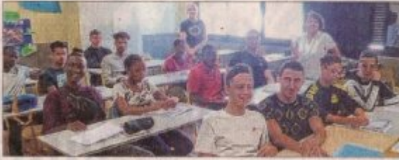
Les élèves de 1 re année CAP, agent polyvalent restauration, commercialisation et services en hôtel café.

Lundi, les élèves de 1 re année bac pro et de CAP du lycée Alexandre-Dumas ont découvert leur nouvel établissement où une semaine d'intégration et de cohésion leur est proposée. Des ateliers et des activités vont animer la semaine des lycéens, théâtre, jeux de piste ainsi qu'un pique-nique géant et un entretien individuel enseignants/élèves. Vendredi 6 septembre, une rencontre professeurs et parents est organisée de 13 h à